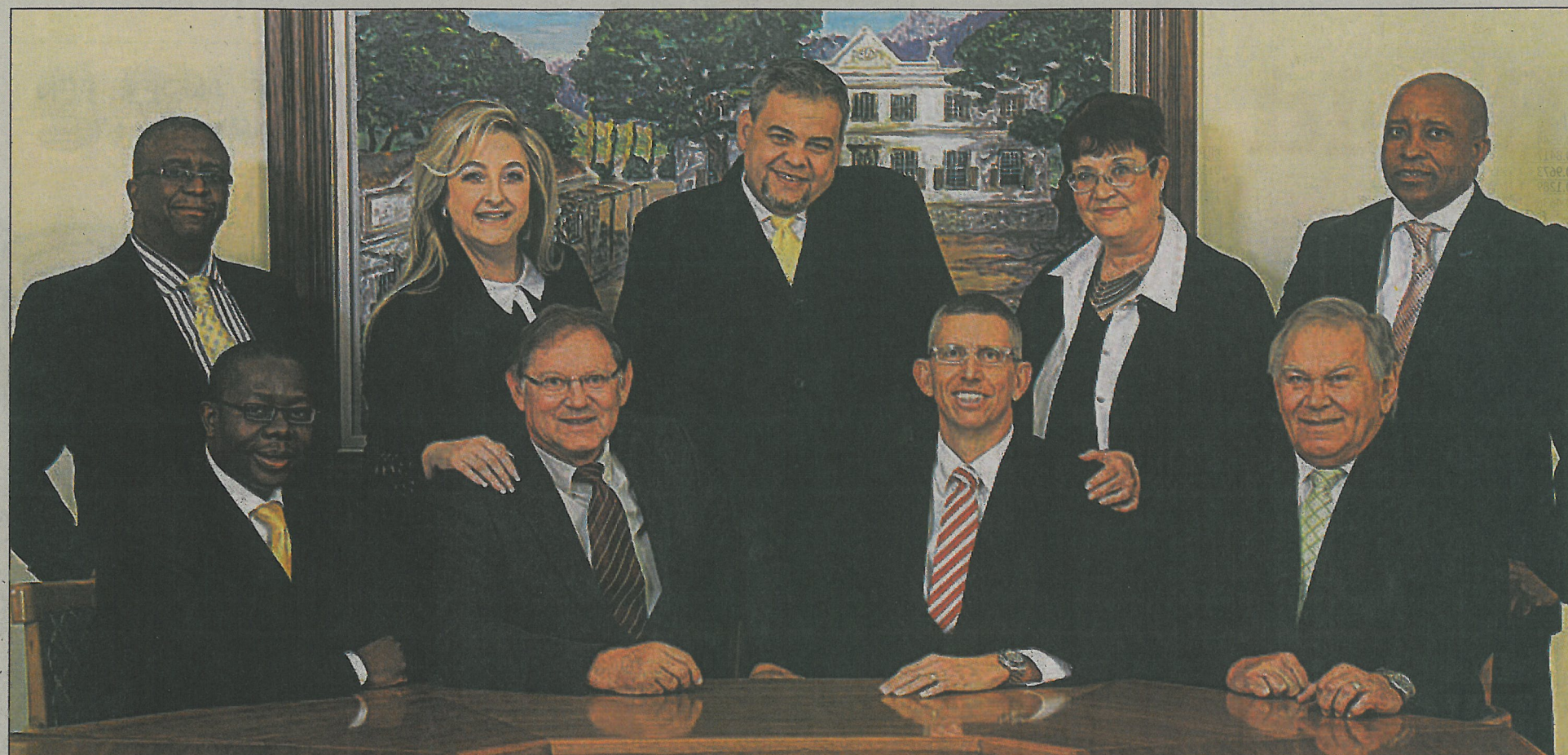
MidCity se direksie

Die maatskappy se wortels is in Pretoria en hy wil in die hoofstad se visie vir 2055 belê.